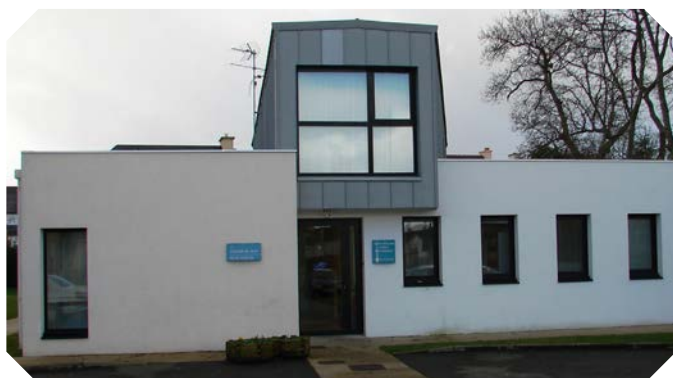
L'Hôpital de Jour "Avel Ys" à Douarnenez