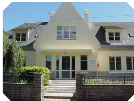
Le CMP Kerarthur à Pont l'Abbé