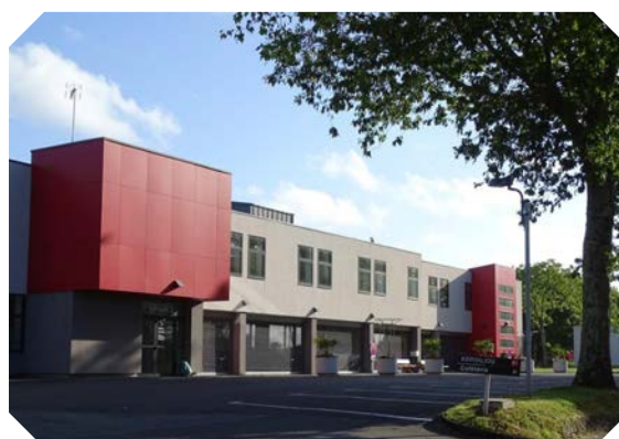
La cafétéria "Silène café" pour les patients de la Clinique 10