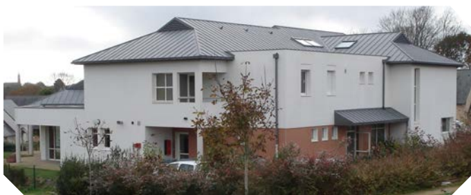
La Maison Thérapeutique des Collégiens et Lycéens (MTCL) à Quimper