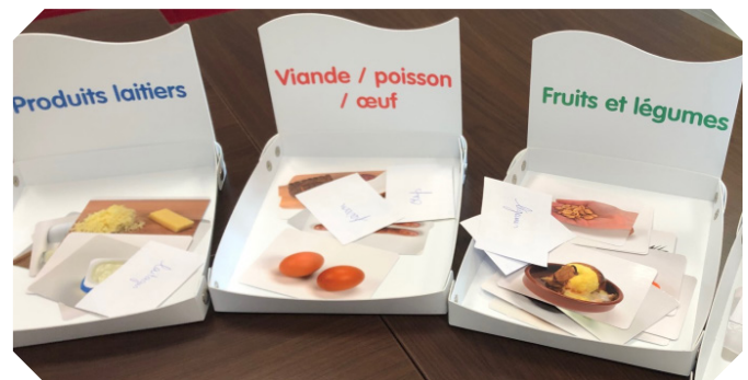
Atelier "alimentation équilibrée"

Ces ateliers sont animés par Gaëlle LE CORRE , diététicienne et un infirmier de chaque structure. Pour les patients de la clinique 10, Catherine L'HARIDON , infirmière à l'UFMP coordonne les inscriptions et accompagne les ateliers à la cafétéria.