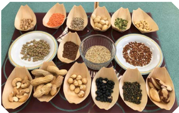
Atelier "alternatives végétales"