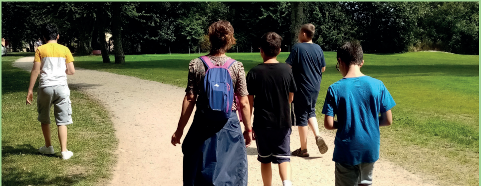
Activité thérapeutique : sortie au parc de Lanniron

Le SESSAD est une structure médico-sociale rattachée au pôle de psychiatrie de l'enfant et de l'adolescent. Cette unité accompagne des enfants et adolescents présentant des troubles du spectre autistique ou un trouble envahissant du développement .